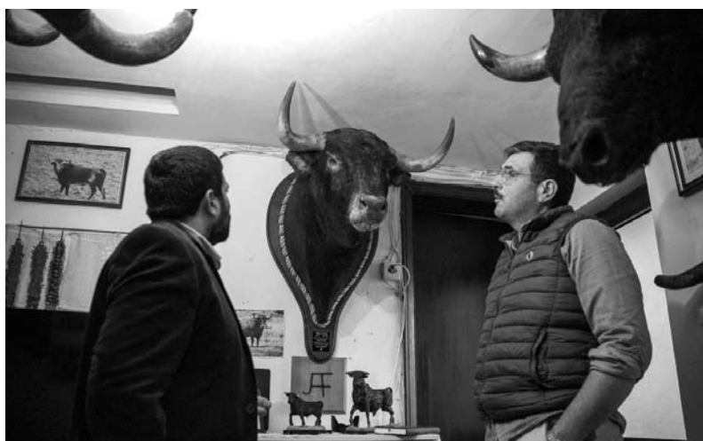
A NOVA AQUISIÇÃO para o pequeno espaço: peça taxidérmica do toiro 216, lidado na Ilha Graciosa em 2024