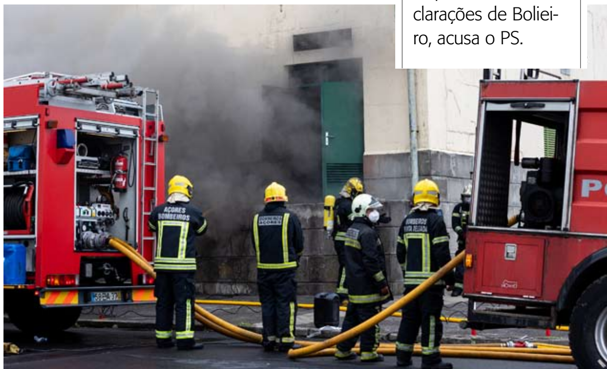
HDES. Hospital foi atingido por incêndio em quatro de maio do ano passado