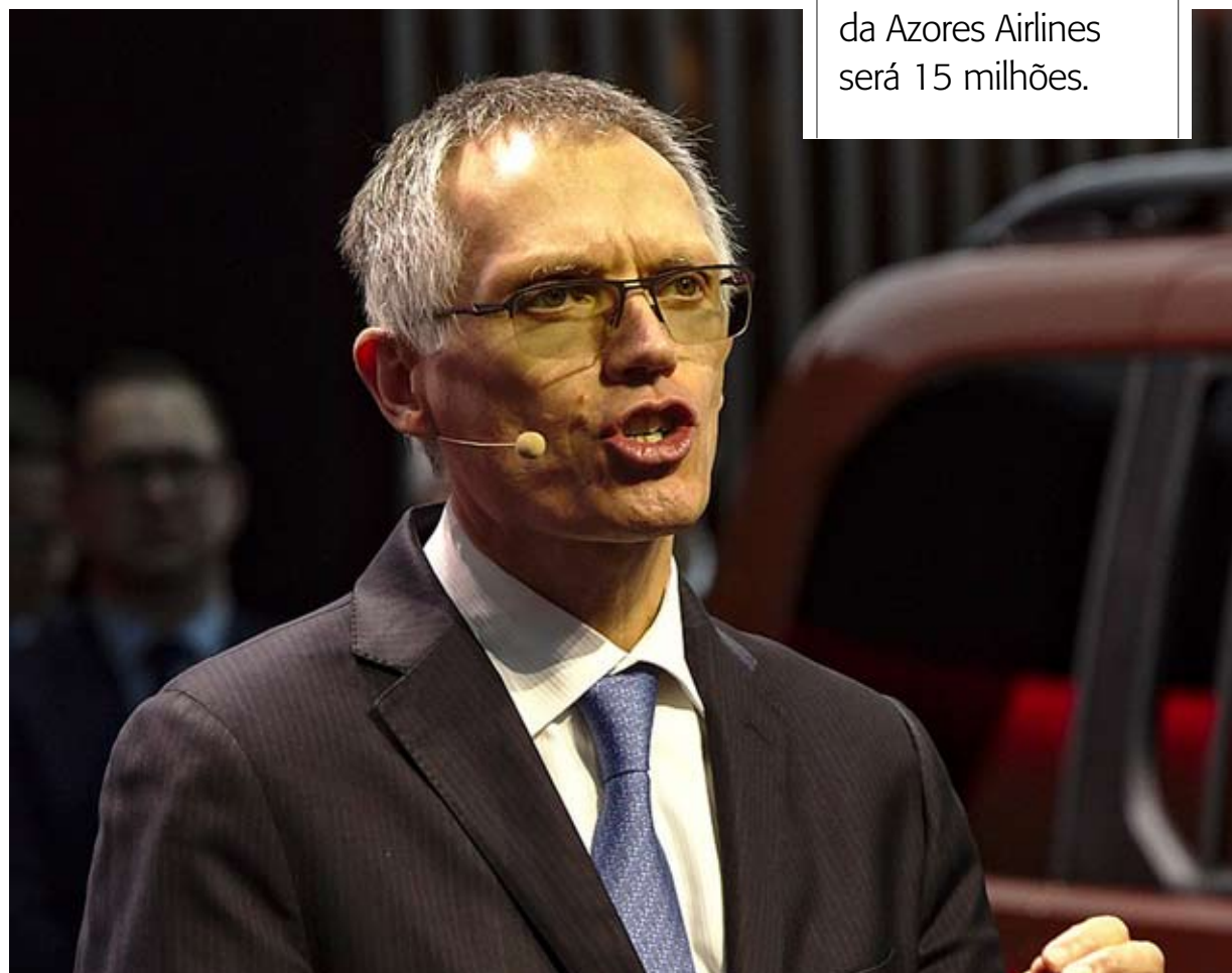
CARLOS TAVARES. “É um porta-aviões no meio do Atlântico, que tem vantagens”

consórcio Newtour/Ms Aviation, o único que ainda negocia com a Região, a procurá-lo. “Foi uma aproximação da parte do consórcio, e à qual tivemos um acolhimento muito aberto e muito positivo”, diz.