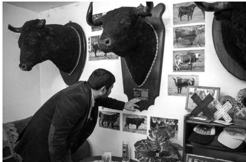
ELUCIDANDO-NOS sobre cada animal ali presente