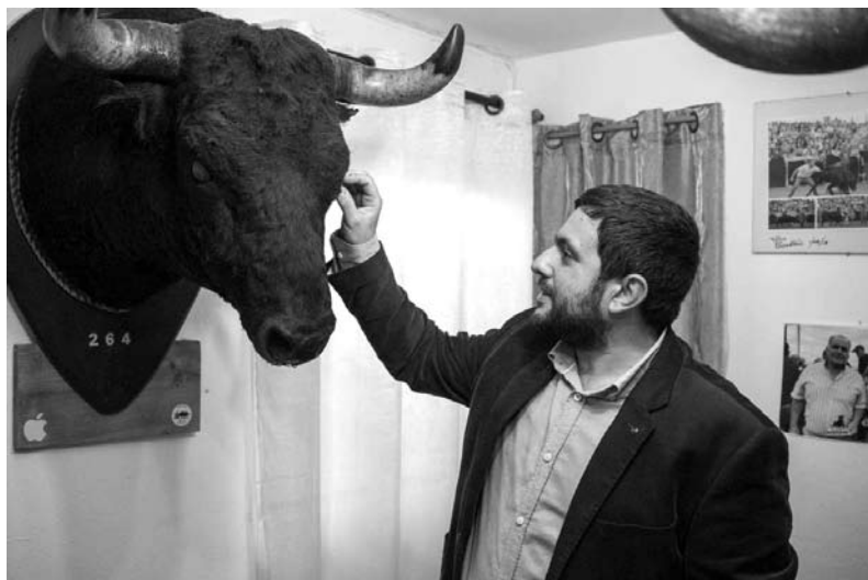
A RELÍQUIA que possui do toiro 264