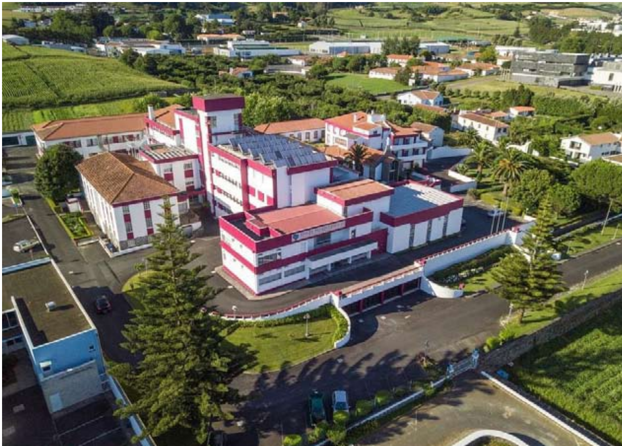
CASA DE SAÚDE. Unidade de Dia Especializada em Demências é inaugurada no dia 07 deste mês

A Casa de Saúde do Espírito Santo, gerida pelas Irmãs Hospitalieras do Sagrado Coração de Jesus, em Angra do Heroísmo, inaugura no dia 07 deste mês, pelas 14h30, a Unidade de Dia Especializada em Demências.