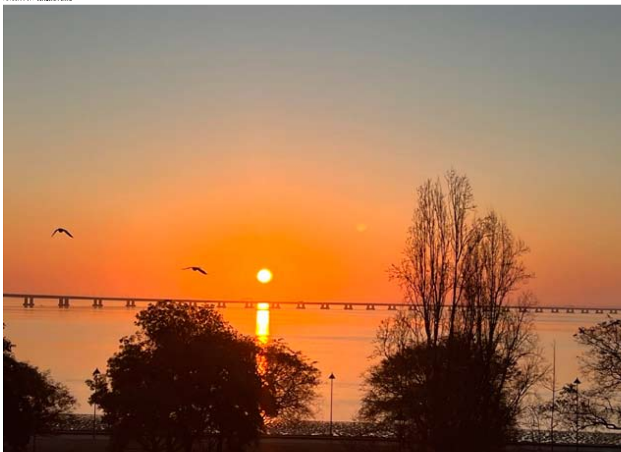
SE uma gaivota viesse trazer-me o céu de Lisboa.... (poema de Alexandre O'Neill cantado por Amália)