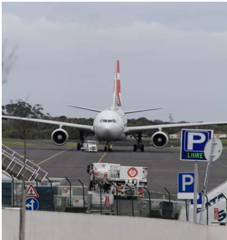
TRANSPORTE. Programa para comboio abre exceção aérea para jovens insulares

Jovens açorianos e também da Madeira podem participar no programa DiscoverEU que acaba de ser lançado e que põe à disposição, de graça, perto de 36 mil