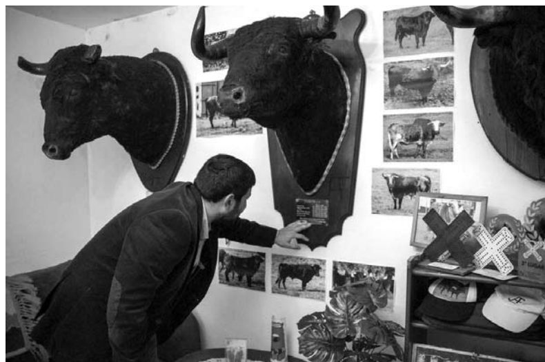
ELUCIDANDO-NOS sobre cada animal ali presente