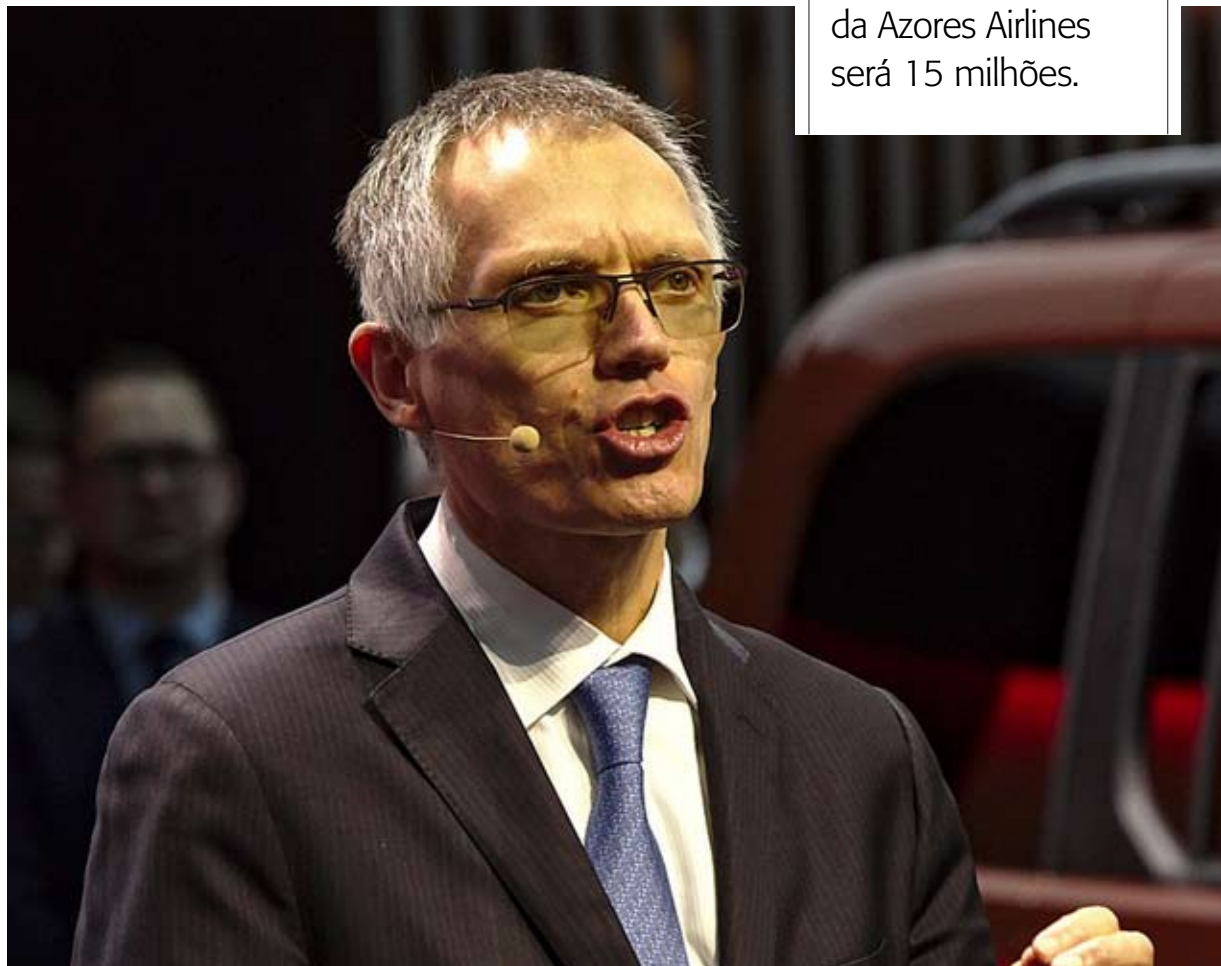
CARLOS TAVARES. “É um porta-aviões no meio do Atlântico, que tem vantagens”

consórcio Newtour/Ms Aviation, o único que ainda negocia com a Região, a procurá-lo. “Foi uma aproximação da parte do consórcio, e à qual tivemos um acolhimento muito aberto e muito positivo”, diz.