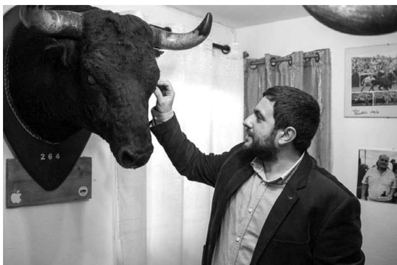
A RELÍQUIA que possui do toiro 264