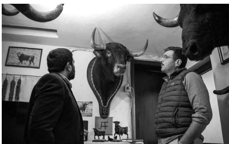
A NOVA AQUISIÇÃO para o pequeno espaço: peça taxidérmica do toiro 216, lidado na Ilha Graciosa em 2024