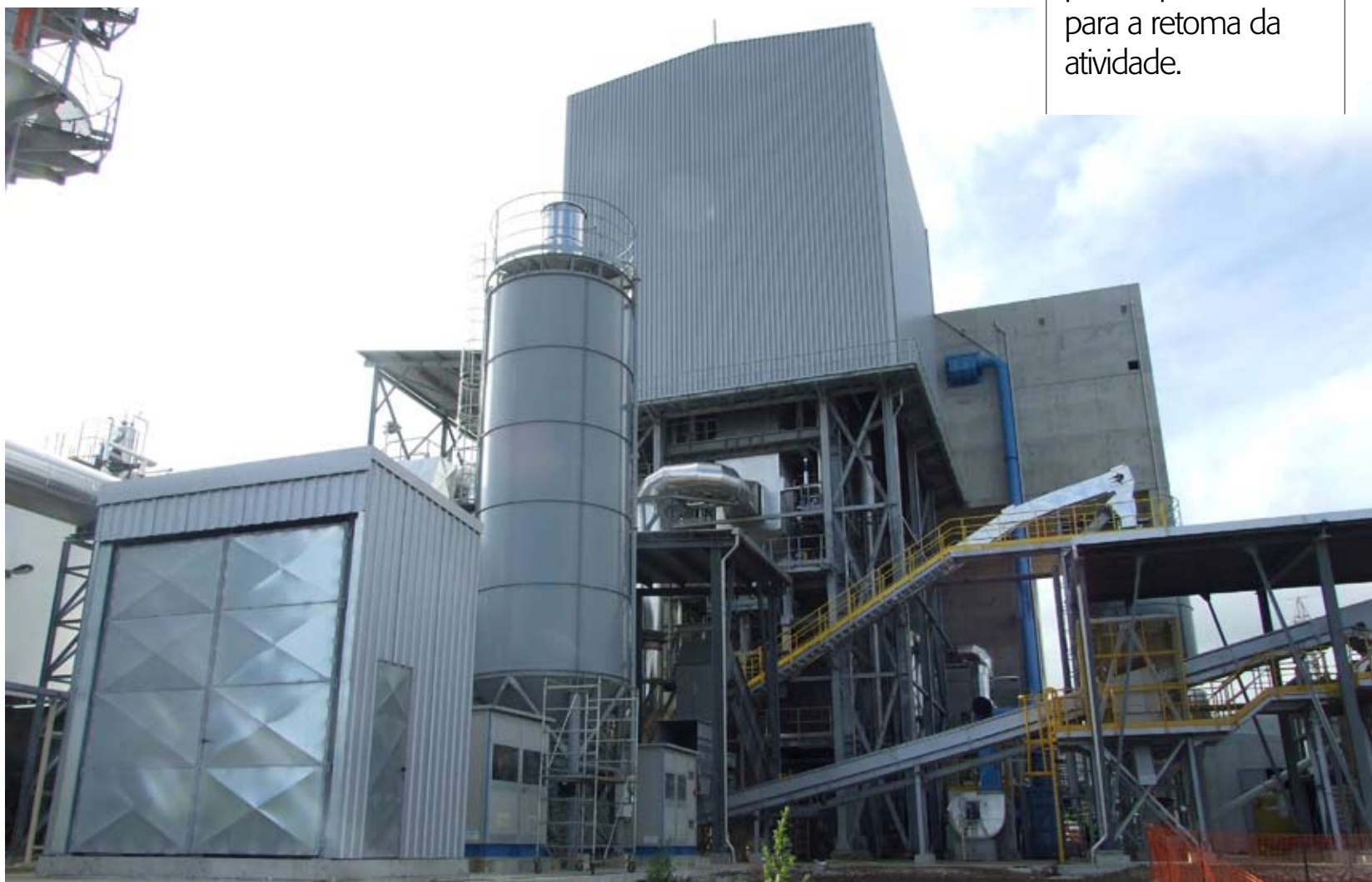
INCINERADORA. Central de valorização energética da Terceira trata resíduos de várias ilhas do arquipélago