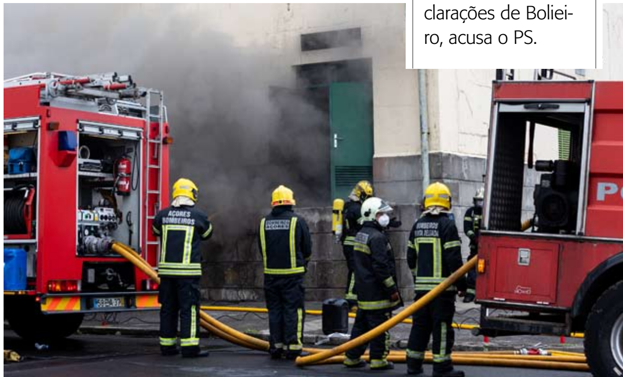
HDES. Hospital foi atingido por incêndio em quatro de maio do ano passado