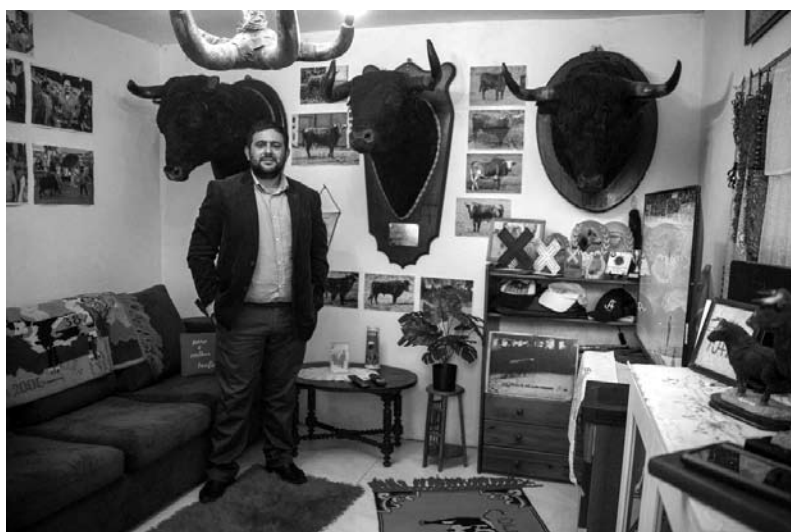
NO PEQUENO ESPAÇO onde alberga 5 peças de taxidermia de toiros bravos