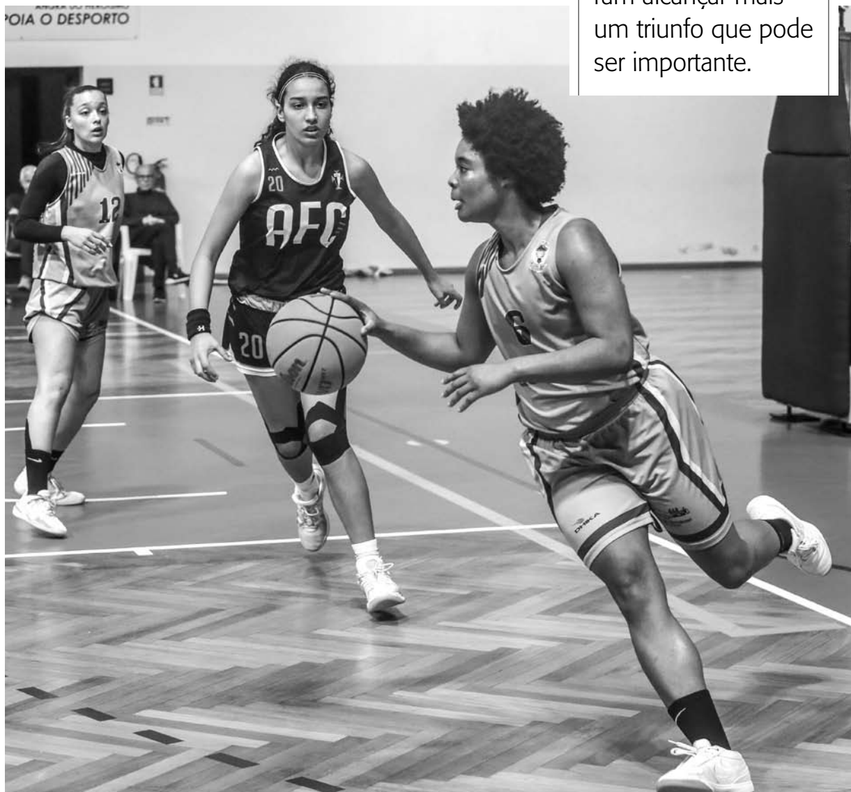
VITÓRIA. Boa Viagem derrotou o Académico por uma diferença de 12 pontos

1.º Quarto: 20 - 19 | 2.º Quarto: 16 - 8 3.º Quarto: 9 - 14 | 4.º Quarto: 21 - 13