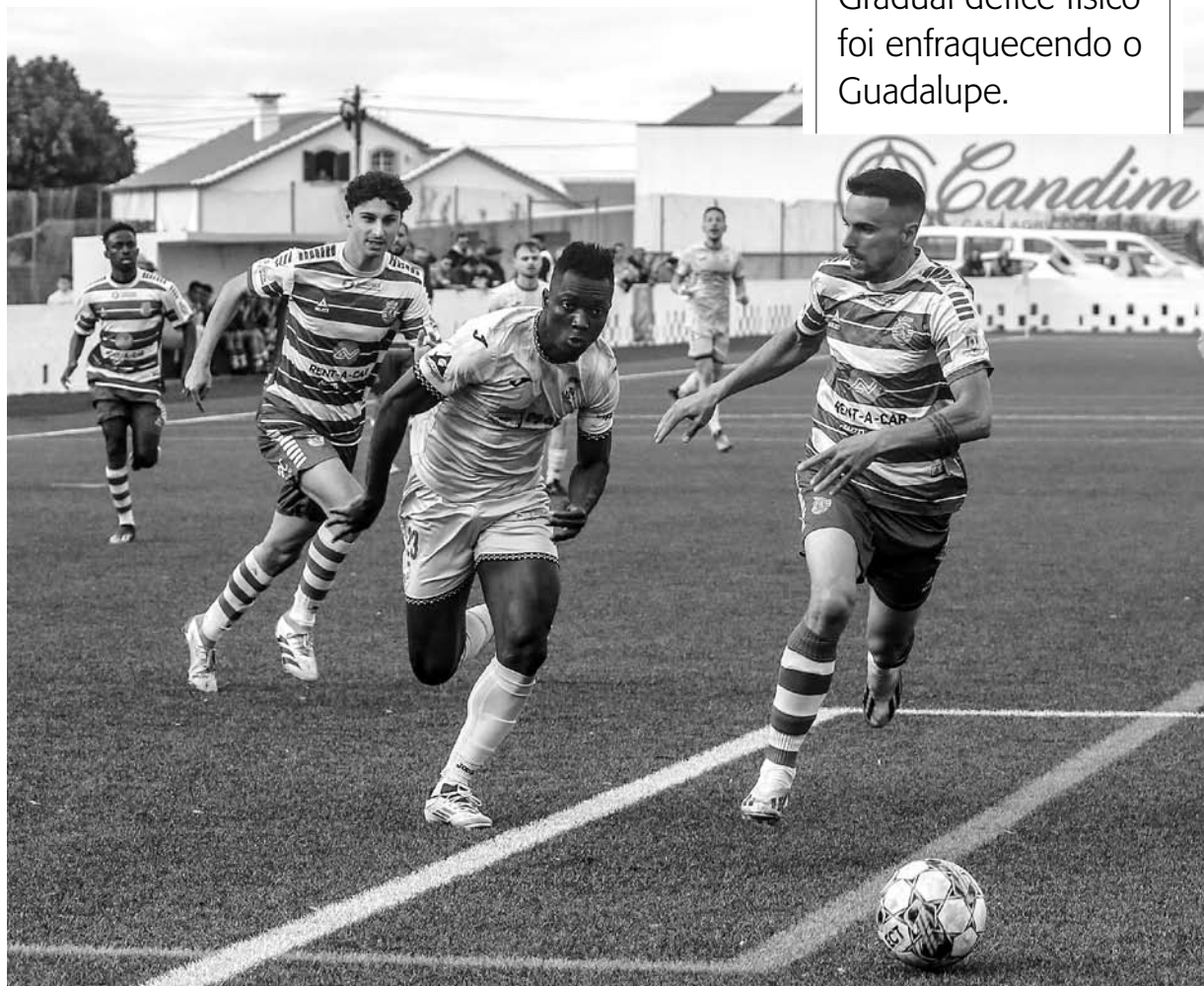
FACILIDADES. "Amarelos" da vila das Lajes "despacharam" graciosenses com uma mão cheia de golos