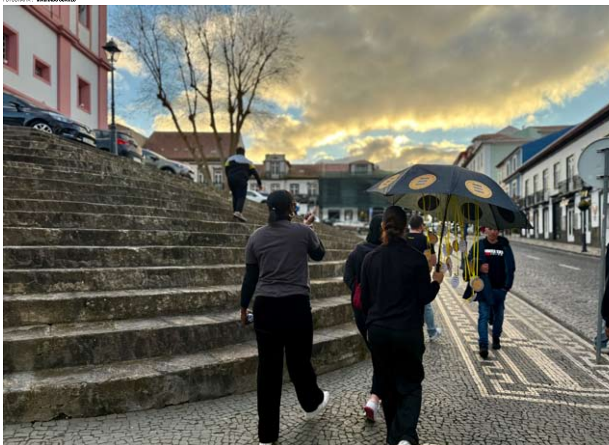
HARMONIA de cores