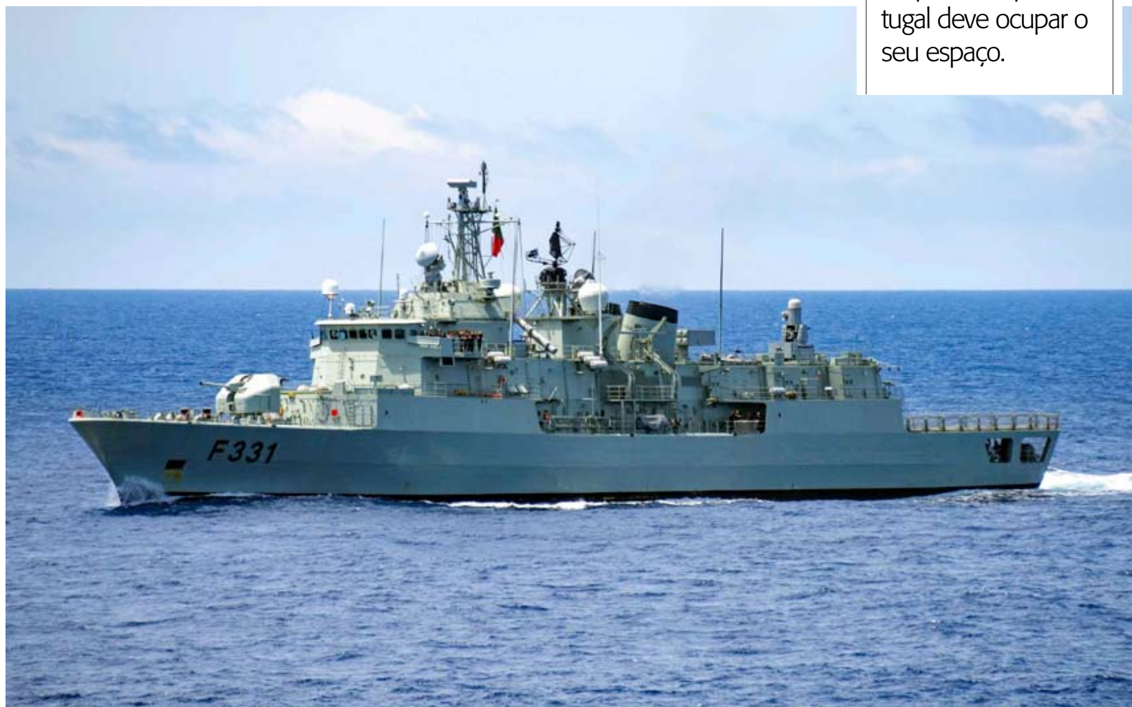
FRAGATA. Álvares Cabral deve ficar em alguns períodos nos Açores

DEFESA. Em entrevista ao “Expresso”, o chefe do Estado-Maior da Armada diz que não há vazios de poder e que Portugal deve ocupar o seu espaço.