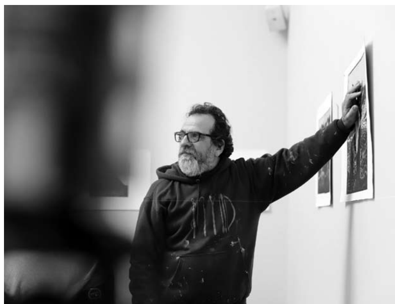
RESIDÊNCIA. Mostra está na Carmina – Galeria de Arte Contemporânea Dimas Simas Lopes

apresentadas de tantas fontes diferentes, portanto, existimos na era do pluralismo. Acho que é difícil para o artista alcançar uma interpretação pessoal da sua existência entre ataques de influências externas, que confundem e distraem da busca pessoal. A existência humana, pela primeira vez, está em perigo devido a coisas como as mudanças climáticas. O papel do artista neste caso é abordar esta questão da forma mais clara possível por meio de um processo criativo. A arte hoje em dia tem o papel de informar o espectador sobre realidades que podem alterar a própria existência. Outra questão que considero muito importante é a inteligência