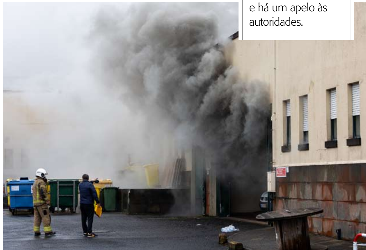
HOSPITAL. Incêndio de 4 de maio do ano passado começou numa bateria de condensadores de correção do fator de potência