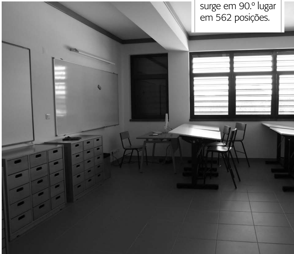
ESCOLAS. Secretária regional da Educação destaca os “bons resultados” alcançados pelas escolas dos Açores

Em segundo lugar, surge a Escola Jerónimo Emiliano de Andrade, de Angra do Heroísmo, com a posição 252 e 3,09 valores de média, e em terceiro a Escola Tomás de Borba, também de Angra do Heroísmo, no 290.º lugar e 3,06 valores de média.