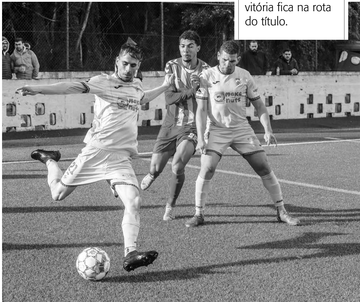
JD LAJENSE. Deslocação à Praia da Vitória pode ser decisiva para o objetivo de vencer o Campeonato de Futebol dos Açores

Caso JD Lajense e Santa Clara B vençam ou empatem os respetivos jogos que vão disputar, a decisão do título ficará marcada para 13 de abril, na vila das Lajes, com um escaldante partida ente ambas equipas que será uma autêntica final, fazendo com que a emoção na disputa do Campeonato de Futebol dos Açores possa decor-