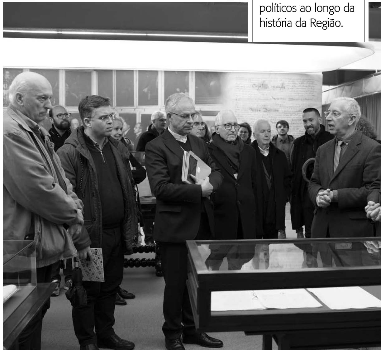
INAUGURAÇÃO. “Um cabido não é conservador ou progressista”, afirma D. Armando Esteves Domingues

“É o caso de José da Fonseca Abreu Castelo-Branco (1829-1901): professor do Seminário Episcopal de Angra, deão da Sé Catedral e Promotor Geral do Bispado. Destacou-se como deputado em várias legislaturas e foi um dos líderes do movimento autonómico no Distrito de Angra do Heroísmo. Aderiu ao liberalismo. Chegou a defender teses republicanas e a independência