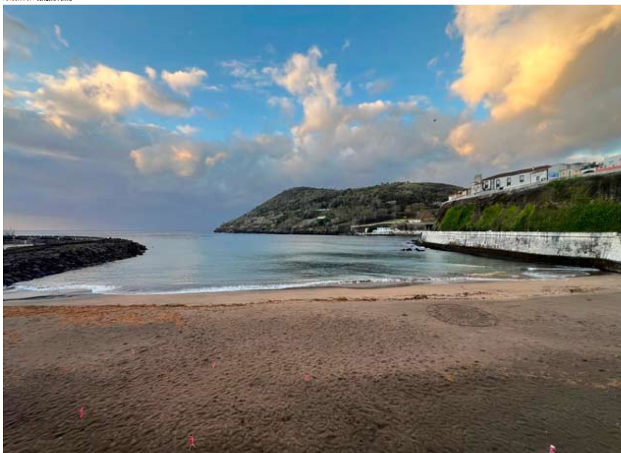
SELO da serenidade