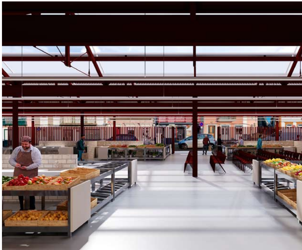
MERCADO. Projeto do gabinete M Arquitetos foi apresentado, ontem, numa sessão pública no salão nobre da câmara

“Ao fazermos isso estávamos a deslocalizar também o centro da cidade em relação ao comércio