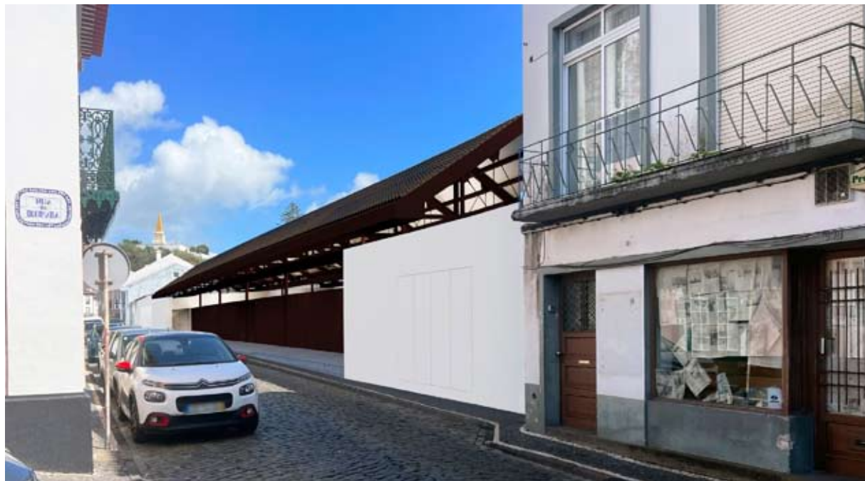
MERCADO. Piso superior fica ao nível da Rua do Rego

No piso superior, que ficará ao nível da Rua do Rego, haverá uma praça coberta, com um palco, onde poderão ser realizados espetáculos, e espaços para 31 postos de venda, incluindo três talhos, três peixarias, três padarias e cinco espaços para cafés ou