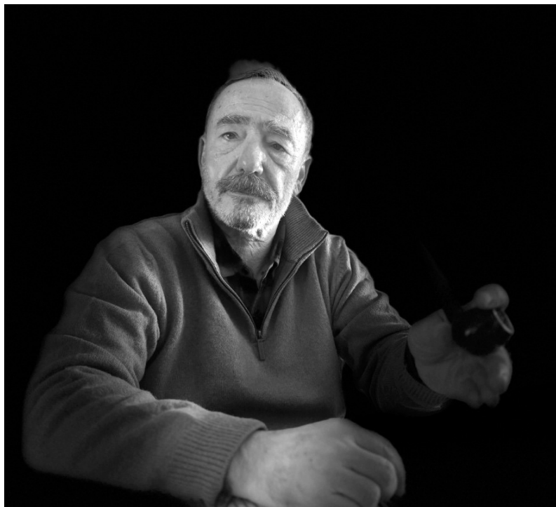
POSTURA DE COLABORAÇÃO. “Mantemo-nos disponíveis para colaborar numa solução justa, transparente e viável para a privatização da Azores Airlines”

Esperamos decisões corajosas, claras e fundamentadas, em prol do interesse público e dos contribuintes açorianos. Mantemo-nos disponíveis para colaborar numa solução justa, transparente e viável para a privatização da Azores Airlines.