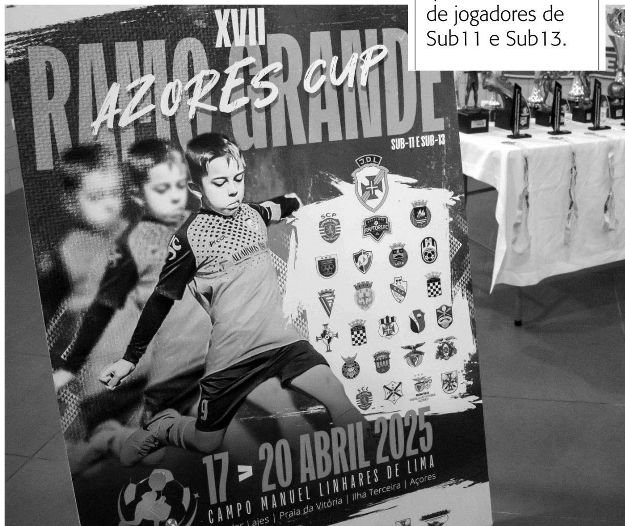
RAMO GRANDE. Torneio conta com maior número de sempre de clubes de fora da Região

JD Lajense (Sub11 e Sub13), Vasco da Gama (Sub11), Ponta da Barca (Sub11), Madalena (Sub11), Fontinhas (Sub11 e Sub13), Alcoitão (Sub13), Os Leões (Sub11), Marítimo da Graciosa (Sub13), EBA do Praiense (Sub11), Câmara de Lobos (Sub13), Boavista da Ribeirinha (Sub11), Atlético dos Arcos (Sub11), Angrense (Sub13), Sporting (Sub11), Calheta (Sub11), Seleção Feminina da AFAH (Sub11), Figueirense (Sub13), Vale Formoso (Sub13), Rio Ave (Sub11), São Roque (Sub13), Poiães (Sub11), Fayal Sport (Sub11), AD Amadora (Sub13) e Rockford Raptors (Sub13), são os