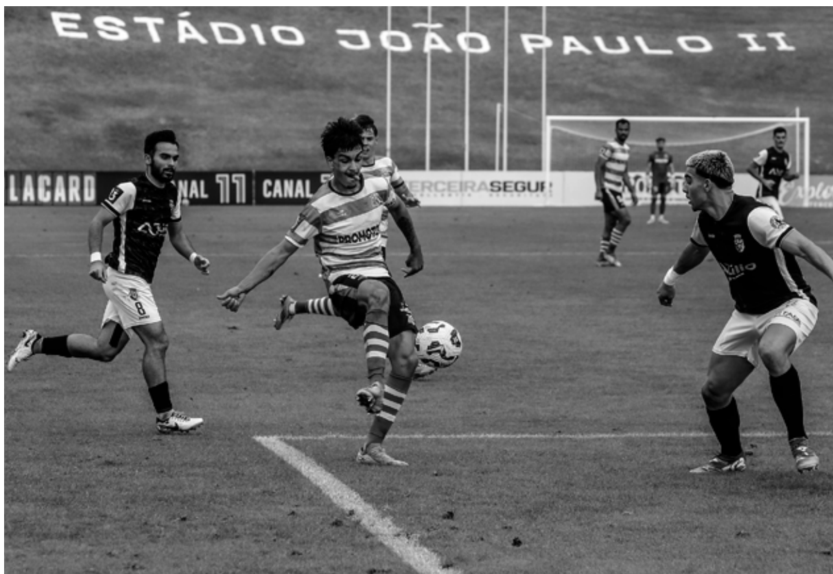
LUSITÂNIA. Equipa quer dar continuidade aos últimos dois resultados em casa em que conquistou pontos

O Lusitânia necessita vencer, domingo, o Caldas para poder continuar na disputa pela manutenção da Liga 3.