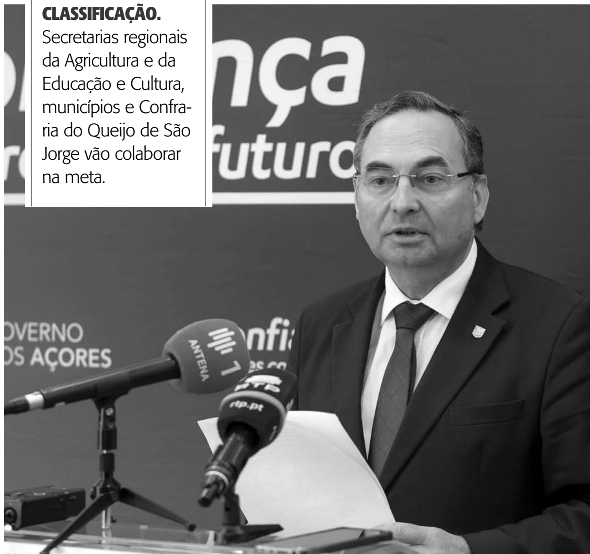
CONSELHO DO GOVERNO. Foram aprovadas várias medidas para a Agricultura

Secretarias regionais da Agricultura e da Educação e Cultura, municípios e Confraria do Queijo de São Jorge vão colaborar na meta.