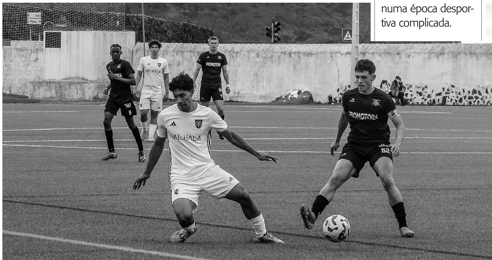
DERROTA. Lusitânia foi incapaz de contrariar o Casa Pia no jogo disputado em São Mateus

FIM DE LINHA. Ao perder em casa com o Casa Pia por 0-2, o Lusitânia confirmou a descida à II Divisão Nacional de Sub19, numa época desportiva complicada.