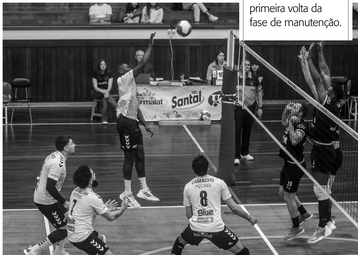
TRIUNFO. Fonte do Bastardo venceu Académica de São Mamede na Praia da Vitória

Melhor início não se podia pedir aos da casa, num primeiro set em que a AJFB entrava determinada e facilmente chegava à vantagem por 5-0 e 13-6, obrigava Nuno Abrantes a pedir os seus dois tempos técnicos. A AJ Fonte Bastardo estava por cima em todas as componentes do jogo, conseguia um jogo variado no ataque e com serviço agressivo (4 ases) e 5 ações positivas no bloco, aumentavam a sua