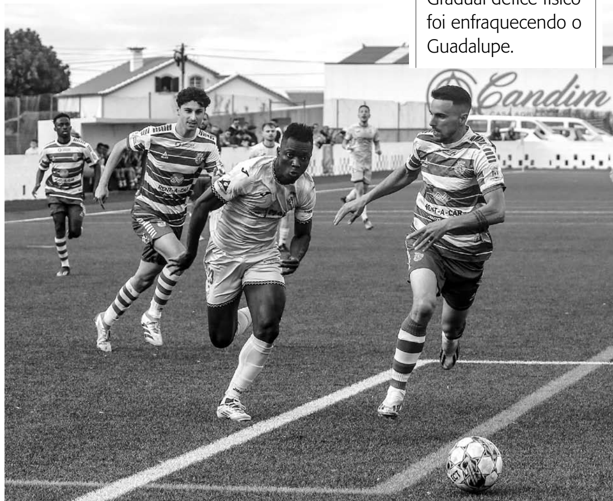
FACILIDADES. "Amarelos" da vila das Lajes "despacharam" graciosenses com uma mão cheia de golos