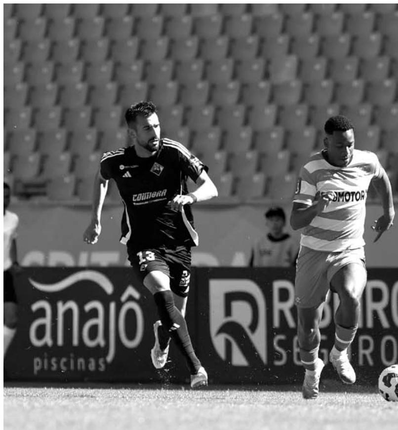
INCONSISTÊNCIA. Apesar de ter marcado primeiro, o Lusitânia não foi capaz de conservar a vantagem e consentiu quatro golos