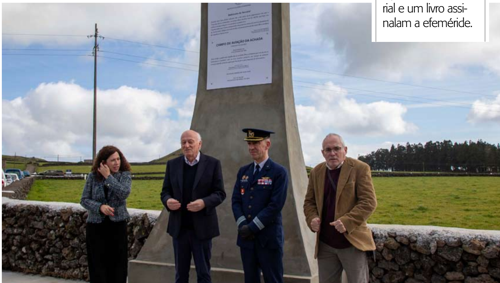
INAUGURAÇÃO. Monumento assinala os 95 anos do primeiro voo em terra açoriana

PIONEIROS. Há 95 anos, o “Açor” aterrava na Achada, dando início ao tempo da aviação nos Açores. Um memorial e um livro assinalam a efeméride.